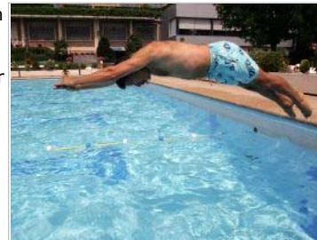
CHAPUZÓN. Un bañista inicia la cuenta de metros tirándose de cabeza.

La asociación vendió también gorros y pañuelos de Kukuxumusu que tuvieron gran éxito entre los nadadores.