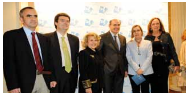
Celebración del 25 Aniversario de ADEMBI

En el acto del 25 Aniversario, el prestigioso escultor vasco Jesús Lizaso presentó la obra que ha creado y donado a la Asociación, en reconocimiento al trabajo que realiza ADEMBI.