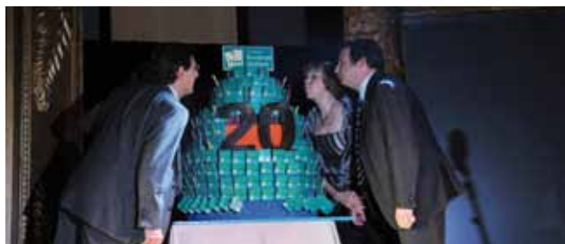
Celebración del 20 Aniversario de la FEM

del 20 aniversario, Jornada de RSC dirigida a empresas... En el segundo semestre se editará un libro que hace un recorrido por la evolución de la Esclerosis Múltiple en nuestro país durante los últimos 20 años.