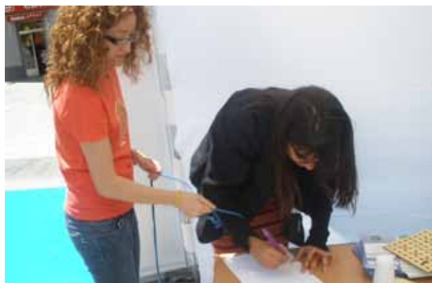
Una voluntaria realiza una simulación de síntomas de la EM

Serán sin duda muchas las oportunidades para transmitir a jóvenes y adultos el interés hacia una acción comprometida de apoyar la mejora de la calidad de vida de las personas afectadas de EM, eso sí, contando en todo caso con un requisito imprescindible para realizar una labor de calidad: la motivación.