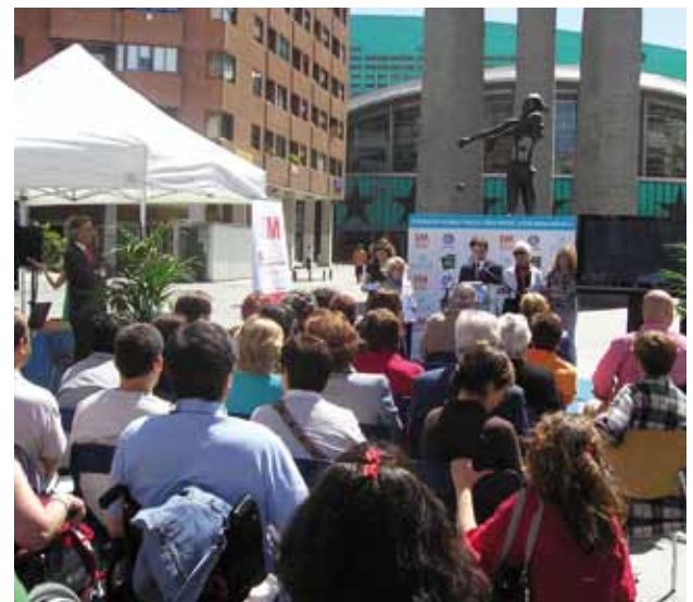
Jornada de sensibilización en Madrid, el día 27 de mayo