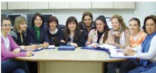
Reunión de los técnicos de promoción de la autonomía personal

FELEM ha puesto en marcha durante el presente año 2009 un nuevo servicio dirigido a las personas con Esclerosis Múltiple (PcEM) y sus cuidadores familiares cuyo objetivo es conseguir la mejora de la calidad de vida de ambos, realizando actividades de apoyo a la promoción de la autonomía personal.