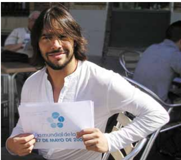
Joaquín Cortés posó con el logotipo del Día Mundial de la EM

El video, protagonizado por personas con Esclerosis Múltiple, trata de personas que afrontan el desafío y encuentran una manera de vivir con EM. El grupo de rock U2 cedió su canción "Beautiful day" como banda sonora del video como muestra de apoyo.