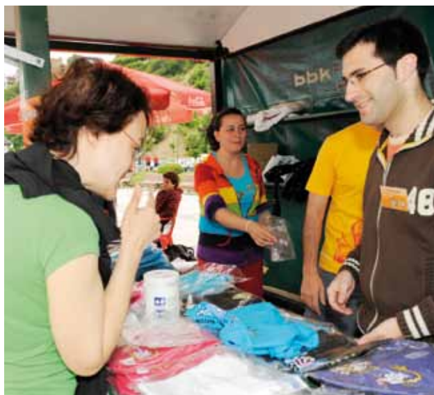
Voluntarios en la campaña "Mójate por la EM"