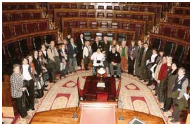
Representantes de FELEM y entidades miembros, junto a las diputadas Conxita Tarruella y Pilar Grande, en el Congreso de los Diputados.

Durante la mañana los asistentes tuvieron oportunidad de compartir inquietudes y novedades en una de las dependencias del Congreso. Durante la reunión, fueron saludados por Gaspar Llamazares (Presidente de la Comisión de Sanidad y Consumo del Congreso de los Diputados) y Emilio Olabarria (Diputado por Álava. G.P.Vasco, EAJ-PNV). Pilar Grande (Portavoz socialista en la Comisión de Sanidad y Consumo) y Francisco Hidalgo (Diputado por Ourense. G.P. Socialista) almorzaron con los representantes de FELEM y entidades miembros en el restaurante del Congreso.