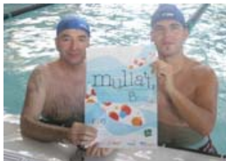
Busqueta y Satorra se bañaron por la esclerosis múltiple

Lleida - Mireia González / Jordi Pascual 2007-07-09